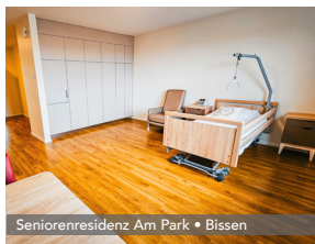
Seniorenresidenz Am Park • Bissen