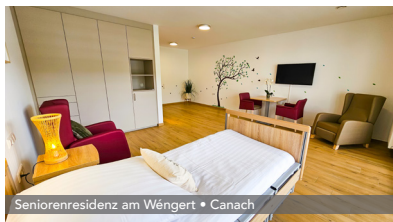
Seniorenresidenz am Wéngert • Canach